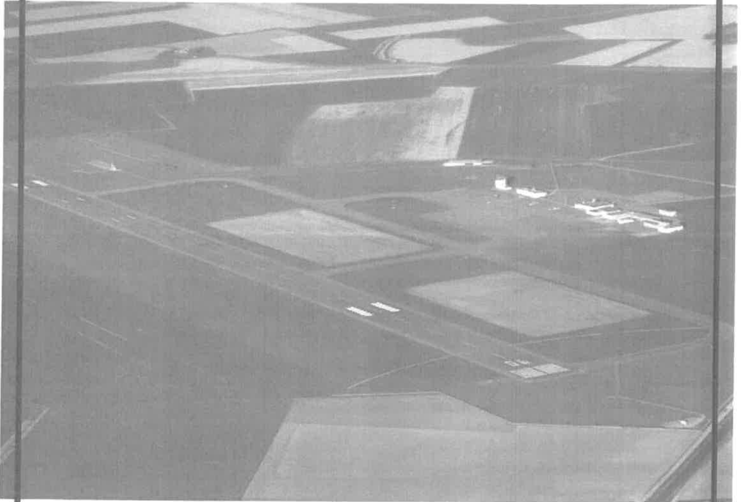
Calais, le ...

auparavant, il devra être retourné à l'exploitant dument complété